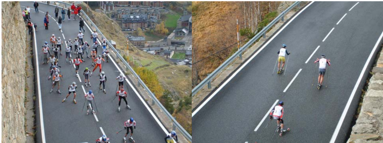
Sortida Circuit Curt o Popular