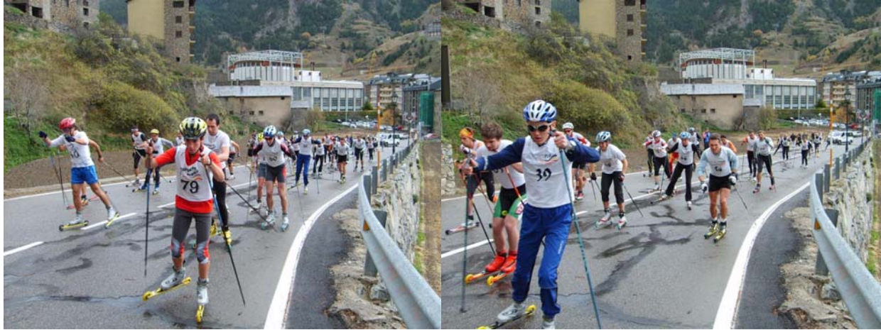
Sortida Circuit Llarg